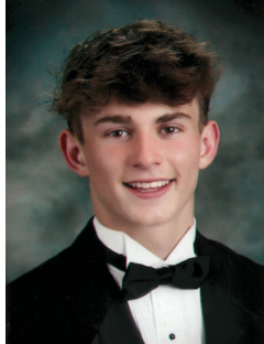
Cooper Rogers Steve Rogers M&H Valve