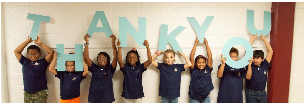
À Anniston, en Alabama, les élèves de l'école primaire Golden Springs montrent leur appréciation du nouveau centre STIM.

Nous abordons l'année 2025 en étant bien positionnés grâce à un contexte propice qui nous a propulsé l'année dernière. J'ai bon espoir qu'en continuant à dépasser les attentes des clients, à faire preuve de responsabilité financière, à fabriquer en toute sécurité des produits de haute qualité et à mobiliser notre personnel par l'intermédiaire de La façon de faire McWane, de grandes choses se profilent à l'horizon.